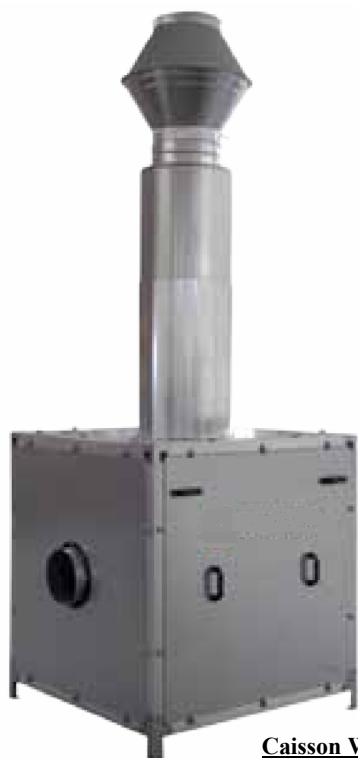
Caisson WPA-BOX Avec sortie verticale

WPA-BOX Avec silencieux à l'aspiration et au refoulement