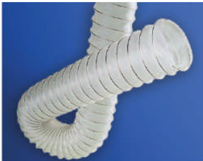
Type PUR/PU en polyuréthane avec acier spiralé.

Pour la ventilation de gaz, poussières, solvant et huile