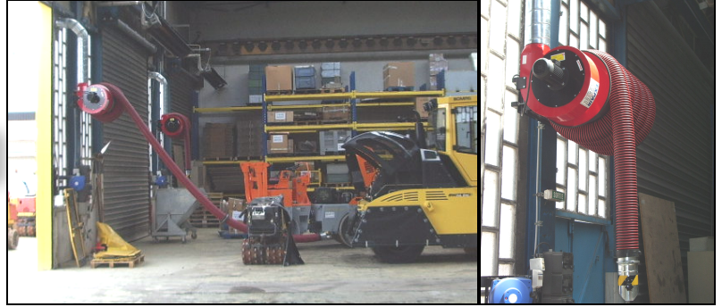
Enrouleur ALAN-U/C-HD avec ventilateur

Un ventilateur d'extraction spécifique peut être fixé directement sur l'enrouleur. Mais l'enrouleur peut aussi très bien être relié à un ventilateur indépendant ou à une tourelle d'aspiration fixée en toiture.